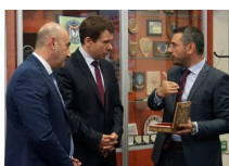
Na zdjęciu Szef CBA wraz z delegacją